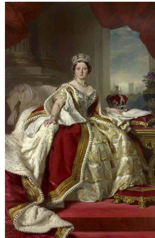
Portrait by Winterhalter, 1859 · Public Domain

考试关键词： Queen Victoria / Victorian Age / British Empire / Great Exhibition 1851