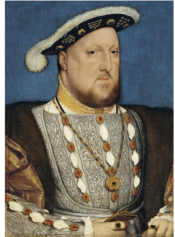
Portrait by Hans Holbein · Public Domain

考试关键词： Henry VIII / Reformation / Church of England