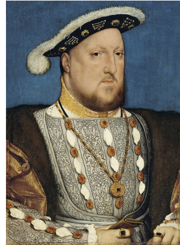
Portrait by Hans Holbein

考試關鍵詞： Henry VIII / Reformation / Church of England