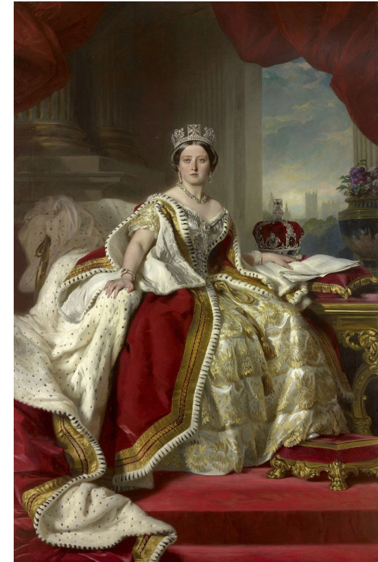
Portrait by Winterhalter, 1859 · Public Domain

考試關鍵詞： Queen Victoria / Victorian Age / British Empire / Great Exhibition 1851